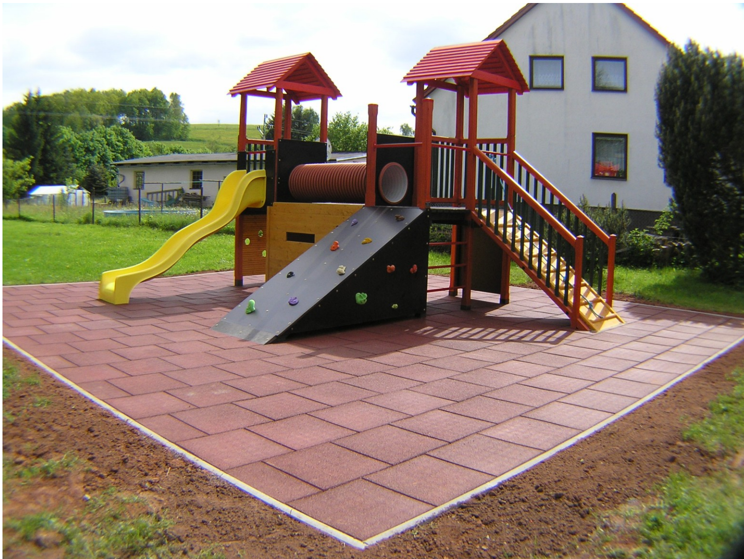
Herní variabilní sestava Flora 09 vybudovaná na zahradě v MŠ