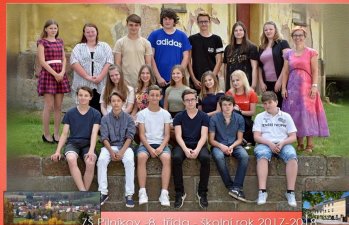
ZŠ Pilníkov -8. třída - školní rok 2017-2018