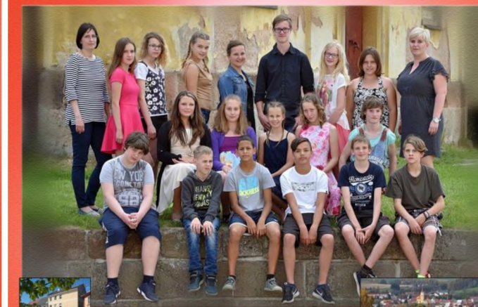
ZŠ Pilníkov -6. třída - školní rok 2017-2018