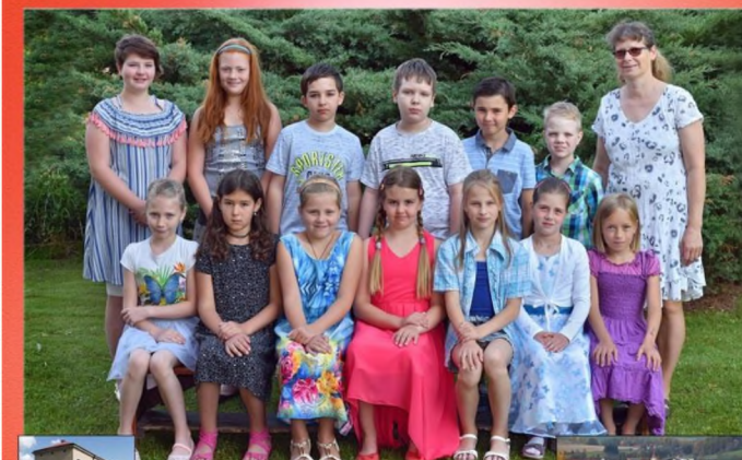
ZŠ Pilníkov -3. třída - školní rok 2017-2018