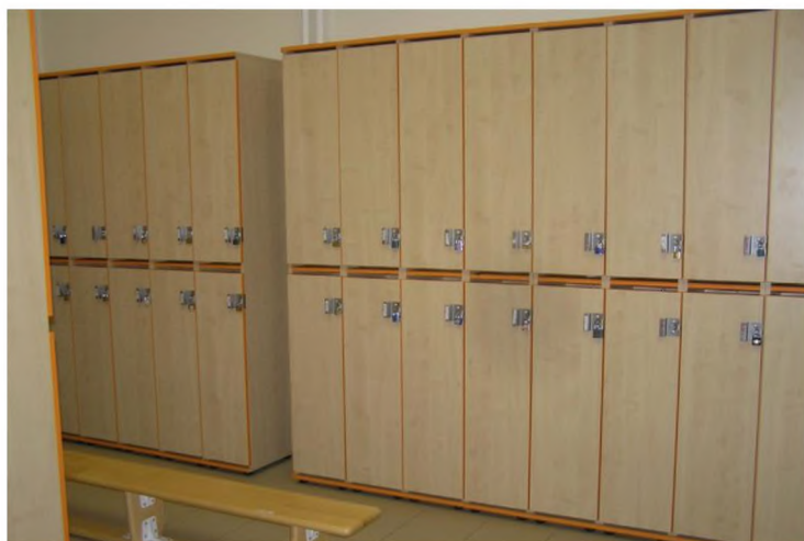
Šatna na II. st. ZŠ