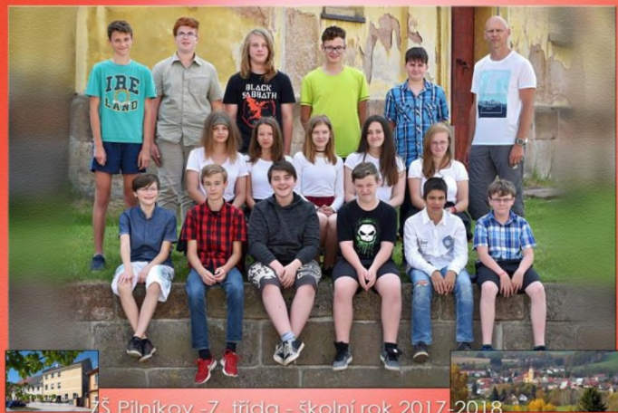
ZŠ Pilníkov -7. třída - školní rok 2017-2018