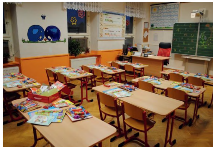
Učebna na I. stupni ZŠ s interaktivním triptychem