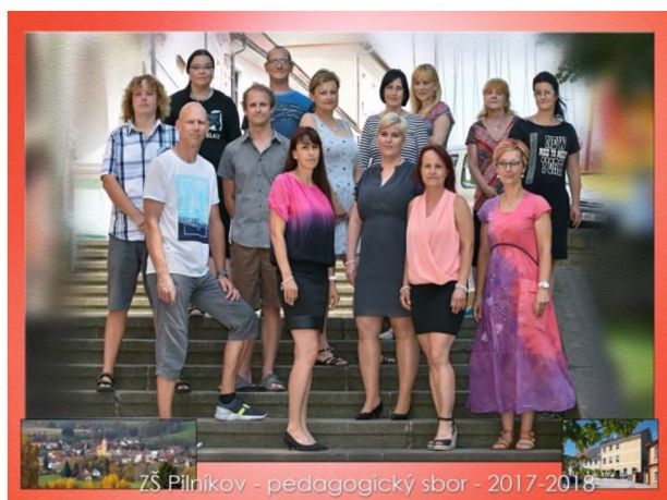
ZŠ Pilníkov - pedagogický sbor - 2017-2018