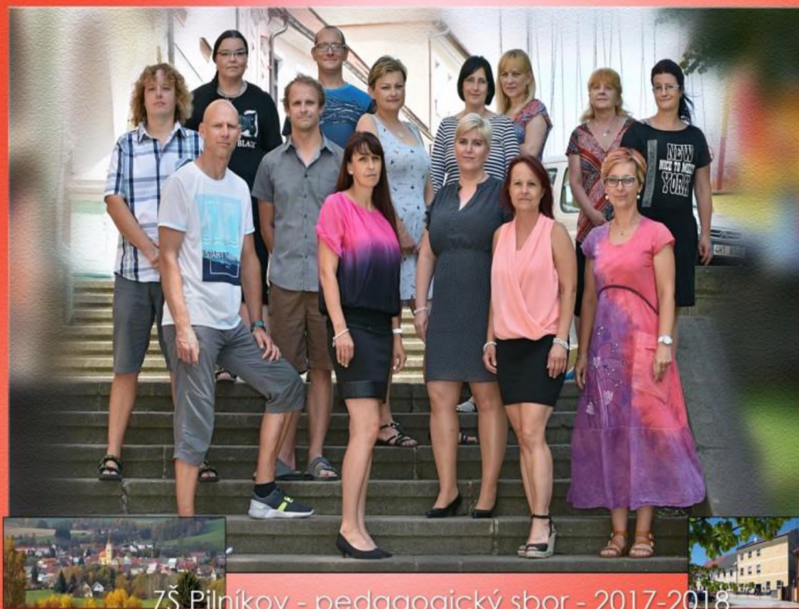
ZŠ Pilníkov - pedagogický sbor - 2017-2018