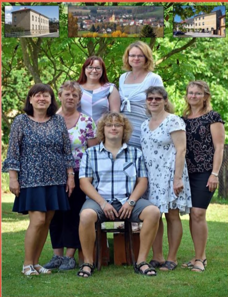
ZŠ Pilníkov - pedagogický sbor - 2017-2018