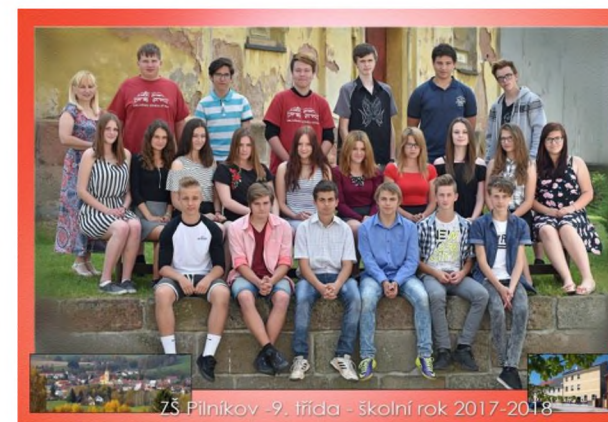
ZŠ Pilníkov - 9. třída - školní rok 2017-2018

Vize: „Chceme být aktivní školičkou, kam všichni chodí rádi a naučí se dovednosti do praktického života.“