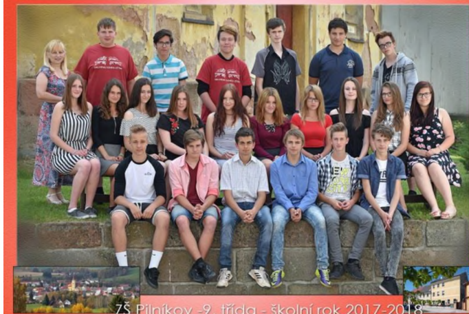
ZŠ Pilníkov -9. třída - školní rok 2017-2018