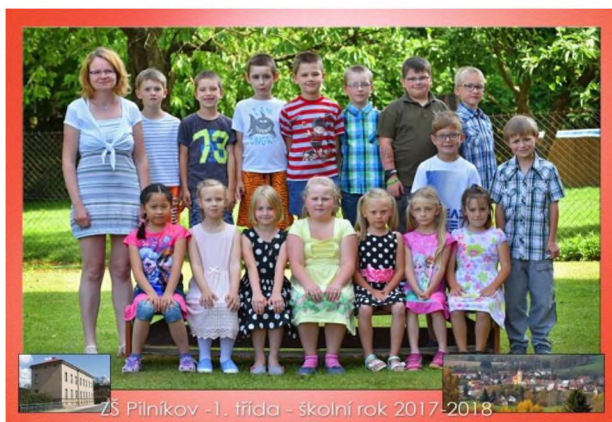
ZŠ Pilníkov - 1. třída - školní rok 2017-2018

ZÁKLADNÍ ŠKOLA A MATEŘSKÁ ŠKOLA PILNÍKOV