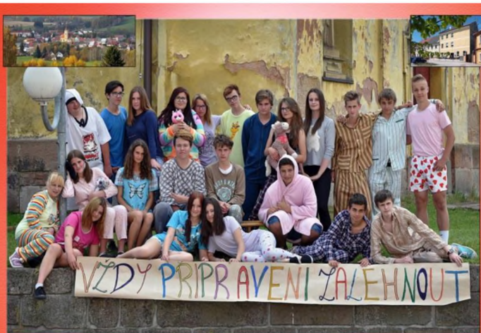
Základní škola Pilníkov -9. třída - školní rok 2017-2018