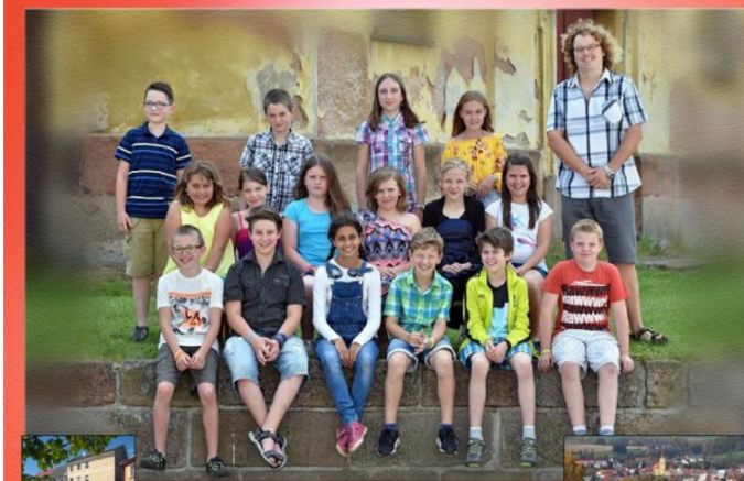
ZŠ Pilníkov -5. třída - školní rok 2017-2018