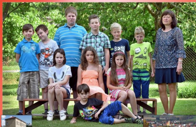
ZŠ Pilníkov -4. třída - školní rok 2017-2018