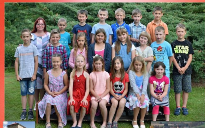
ZŠ Pilníkov -2. třída - školní rok 2017-2018