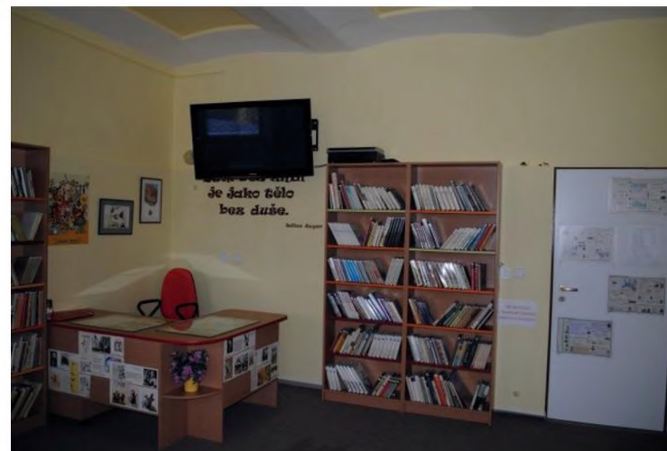
Knihovna, relaxační místnost