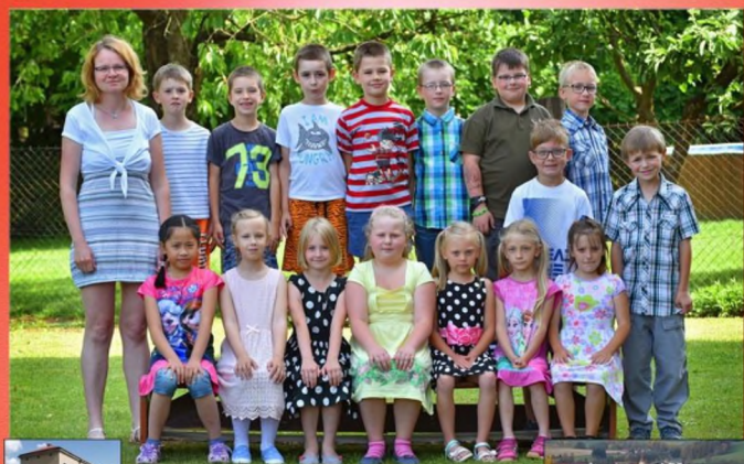
ZŠ Pilníkov -1. třída - školní rok 2017-2018