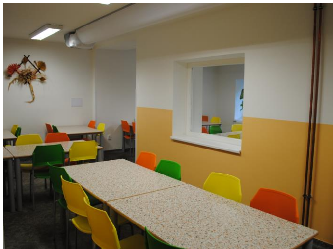
Prostory školní jídelny