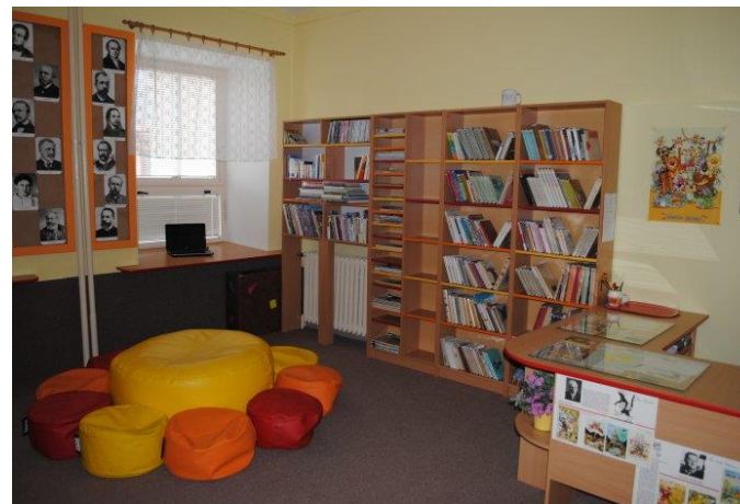
Knihovna, relaxační místnost