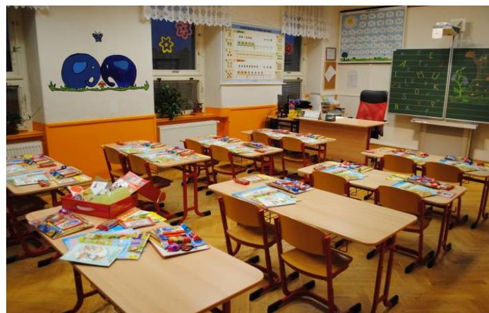
Učebna 1. tř. s interaktivním triptychem