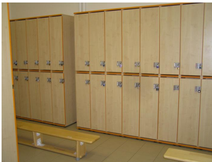
Šatna na II. st. ZŠ