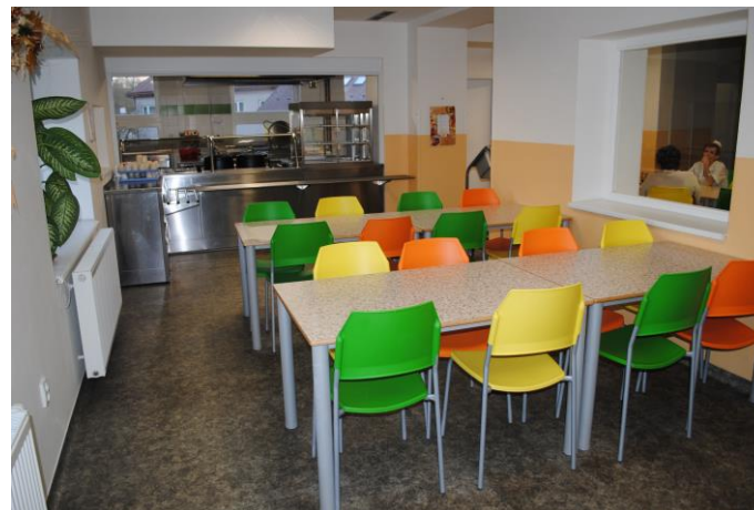
Prostory školní jídelny