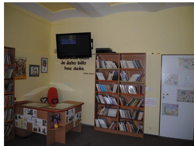
Knihovna, relaxační místnost