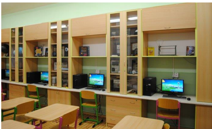
Multimediální učebna s PC