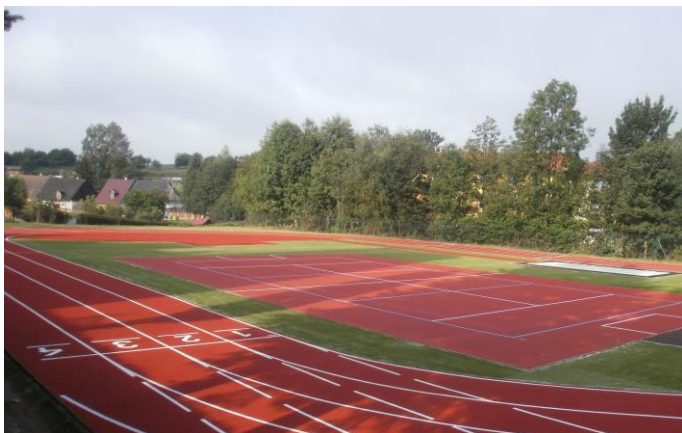
Školní atletické hřiště s umělým povrchem Conipur