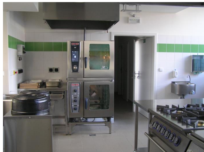
Prostory školní kuchyně